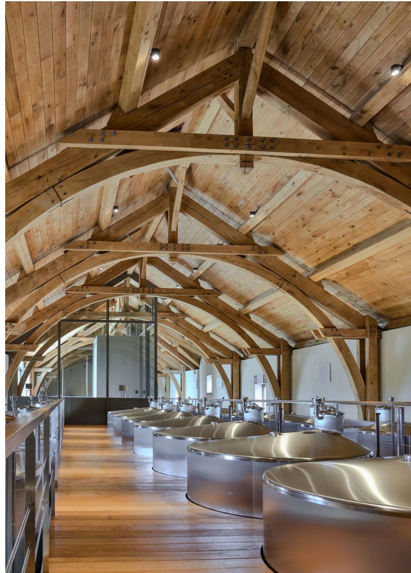
Maison de Champagne Barons de Rothschild